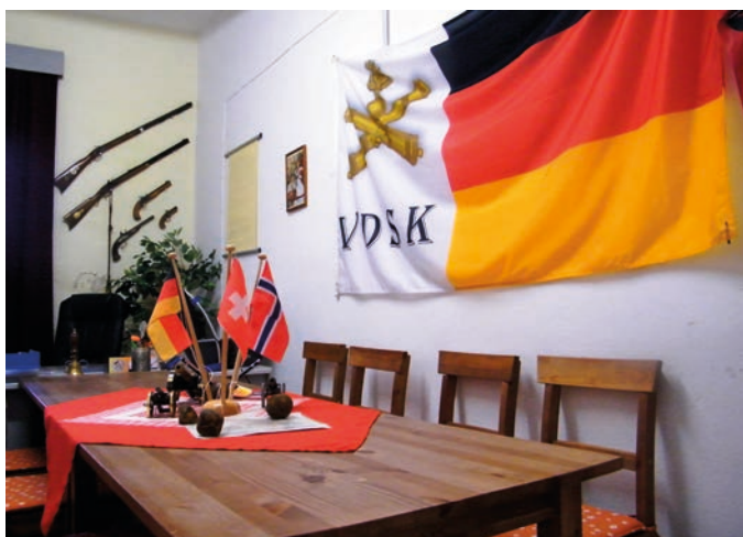
Links: Büro des VDSK in der Burg