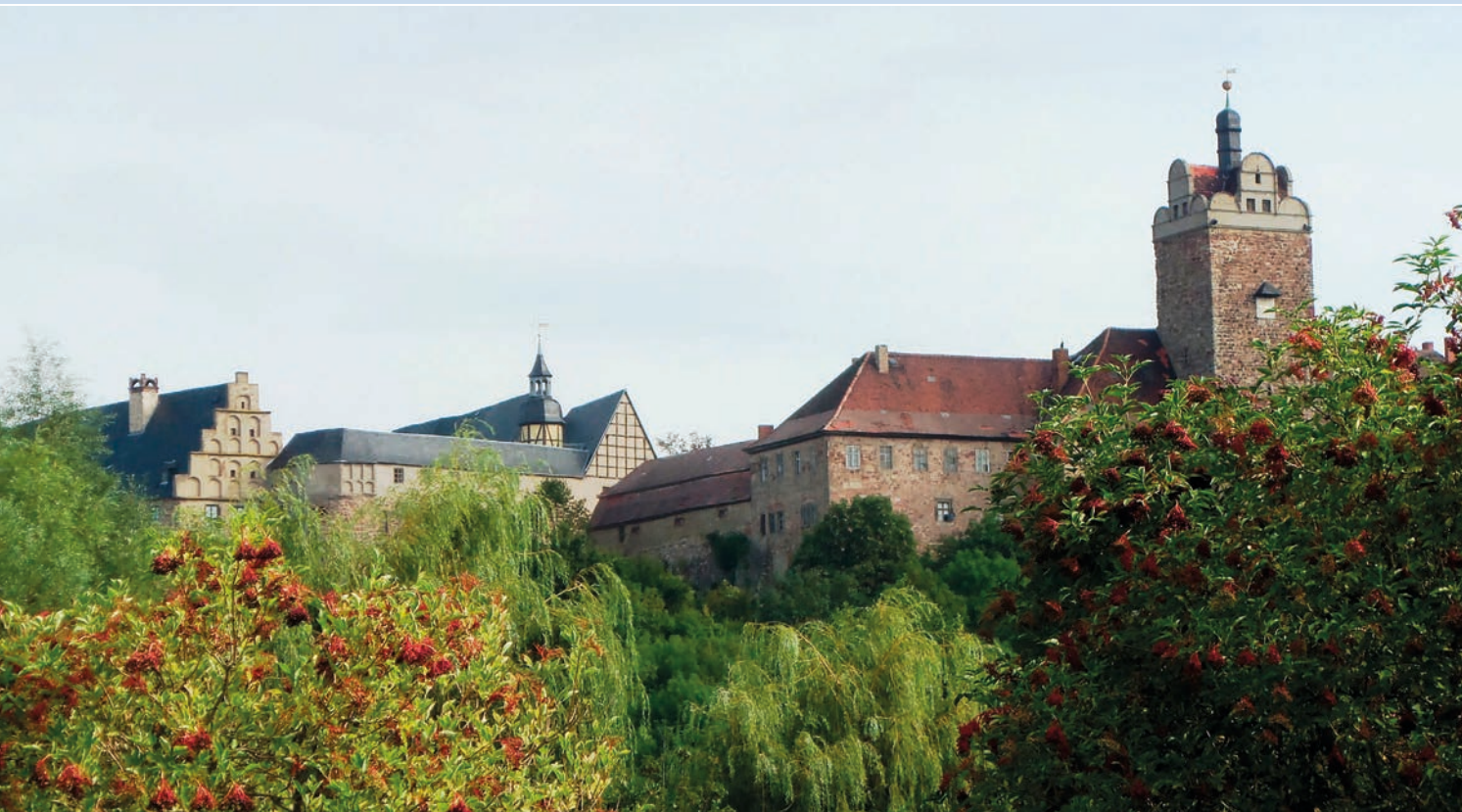
Burg Allstedt - Sitz des VDSK Burg

In der Zeit von 2006 hat sich der Verband zum größten Kanonierverband in Europa entwickelt. Worüber wir sehr stolz sind. Mit