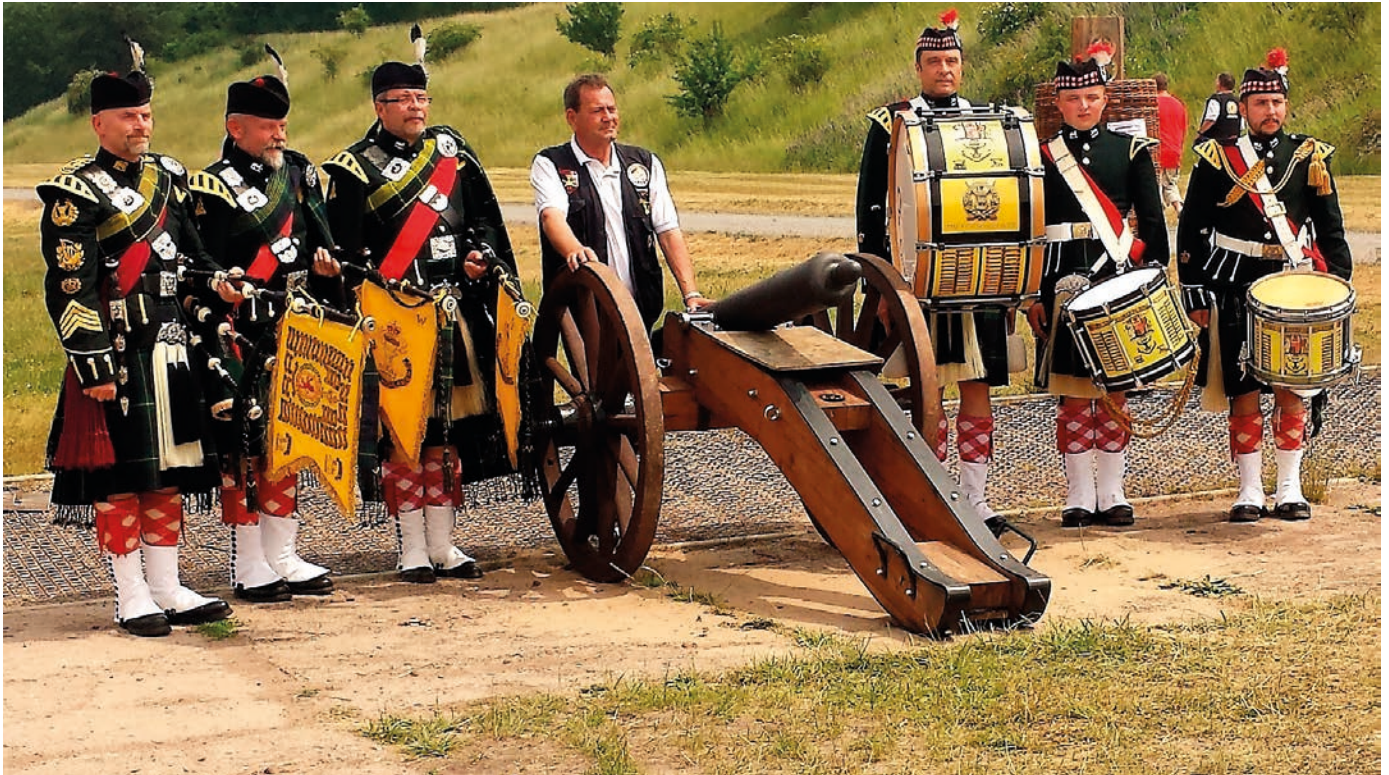
The Gordon Pikes

Jährlich findet die Europameisterschaft auf dem Standortübungsplatz der Bundeswehrereinheit in Sondershausen statt. Die gemeinsamen Veranstaltungen sind in der Region und mittlerweile in der Bundesrepublik zu einem sehr geachteten Termin geworden, in der die Öffentlichkeit und die Gesellschaft gern gesehen sind, was auch die Besucherzahlen, die Resonanz im VDSK und die Mitwirkungsbereitschaft der Bundeswehr belegen. Nur in dieser Kooperation und Kameradschaft sind die gemeinsamen Aktivitäten in einem hohen Maß öffentlichkeitswirksam. Es ist Grundanliegen beider Partner, das Interesse für Militärtechnik und Artillerie über die Region hinaus zu wecken und erlebbar zu machen. Mit dem militärhistorischen Museum der Bundeswehr in Dresden und dem VDSK werden gemeinsame Projekte der Artillerie im Mittelalter durchgeführt, und im Rahmen der Militärgeschichte publiziert.