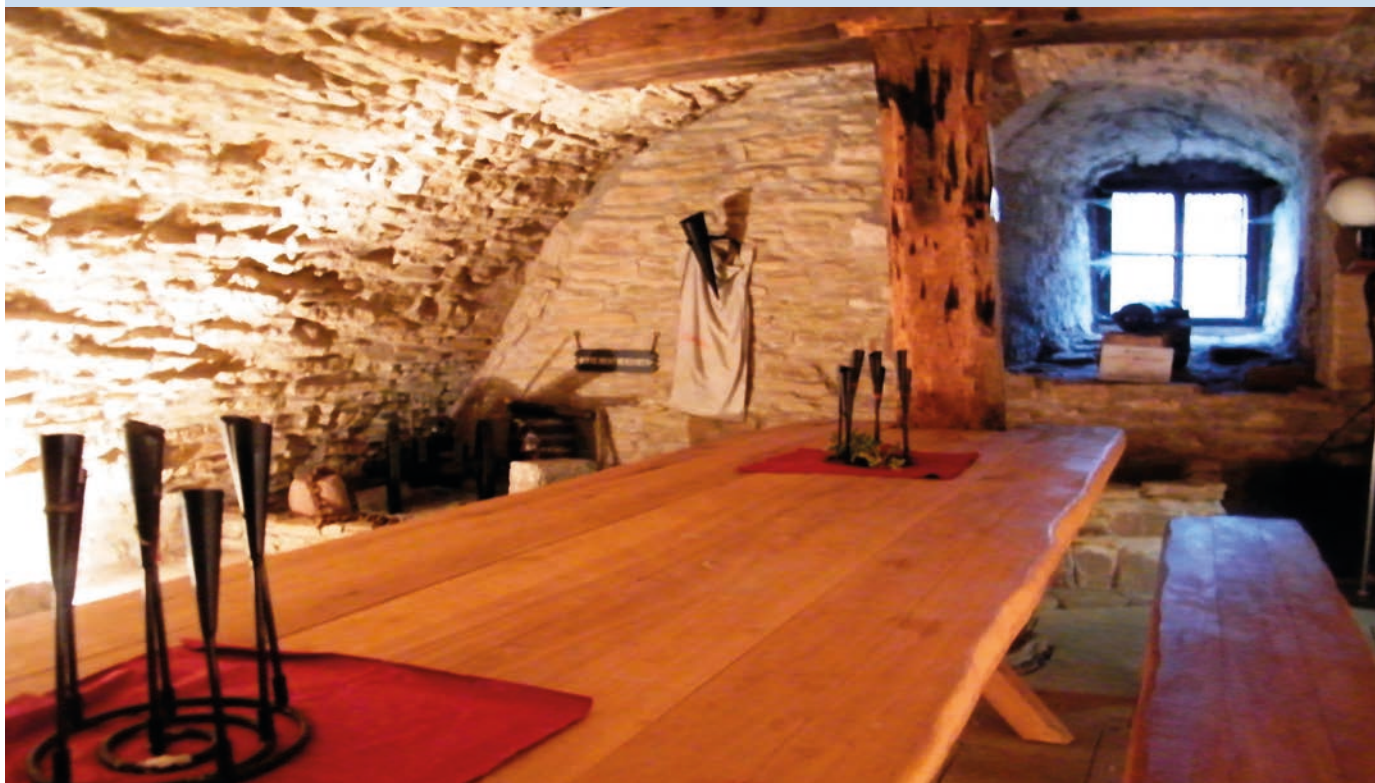
Pulverkeller in der Burg