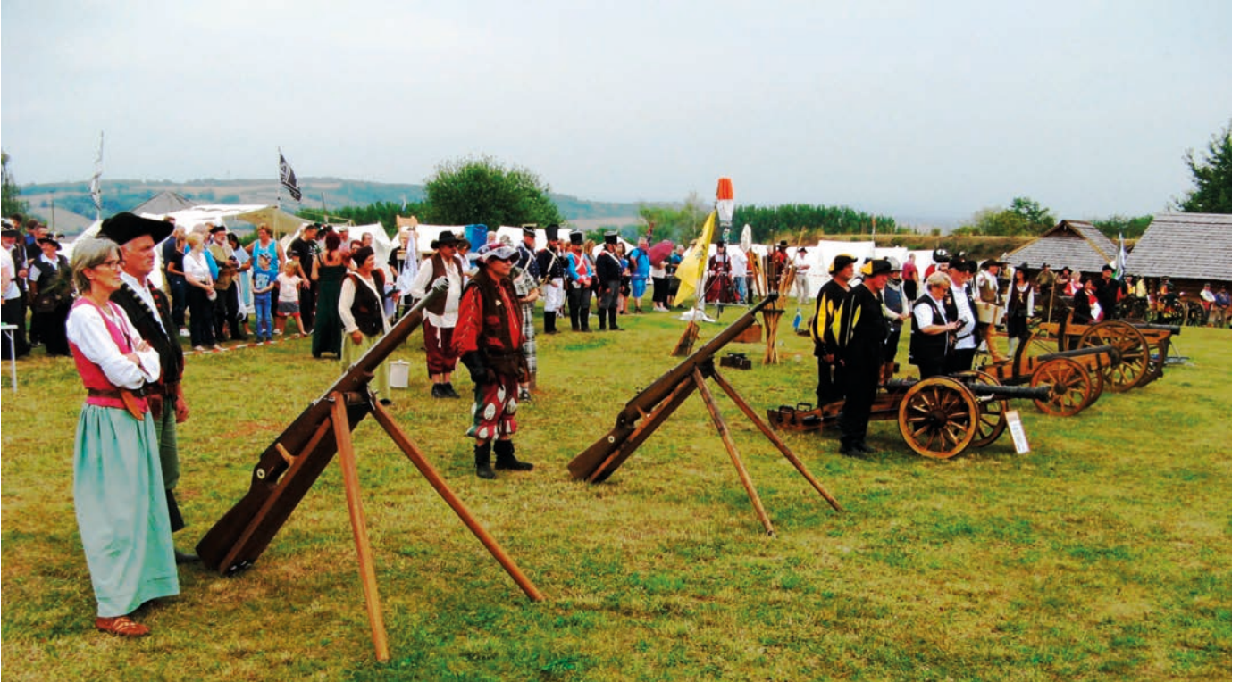
Oben: Aufstellung der geweihten Geschütze ---- Unten: Nachtböllern

Dies war überhaupt die erste Brauchtums-Großveranstaltung seit März in Sachsen-Anhalt welche unter den Corona-Bedingungen genehmigt wurde. Die Kanoniere waren sehr erfreut darüber, denn sie hatten ja bereits seit März mit den „Hufen“ gescharrt. Natürlich hatten wir auch einige Einschränkungen. So wurde kein Einmarsch der Gruppen, keine offizielle Eröffnung, keine Livemusik und kein Feuerwerk durchgeführt. Das war aber kein Problem für die Teilnehmer. Natürlich wurden aber die Ehrengäste offiziell begrüßt. Von Seiten der Bundeswehr begrüßten die Kanoniere Herrn Brigadegeneral