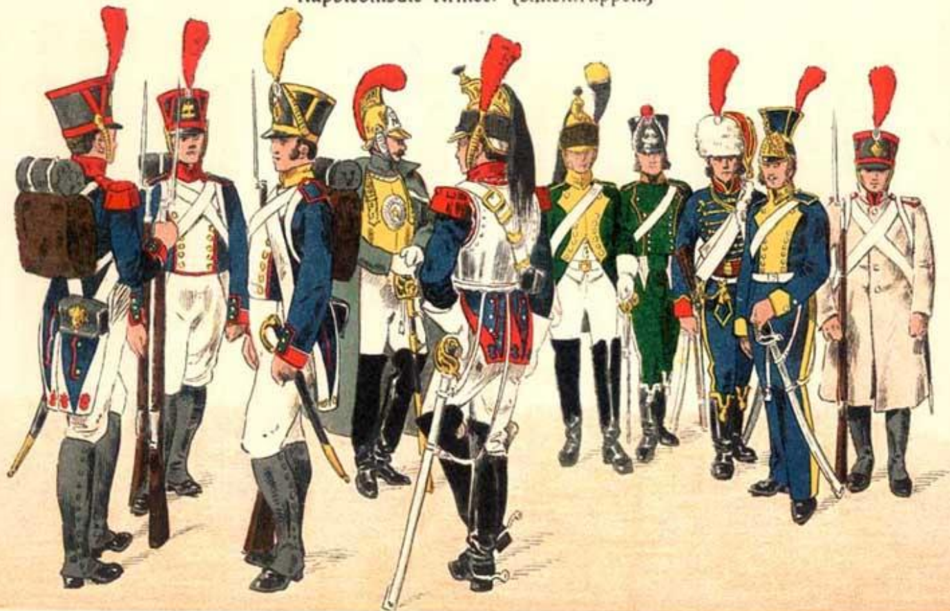
Grenadier. Fusilier. Voltigeur. Karabinier. (Offizier.) Kürassier. (1. Reg.) Dragoner. (21. Reg.) Jäger zu Pferd. (22. Reg.) Husar. (11. Reg.) Lancier. (7. Reg.) Infanterist im Mantel.